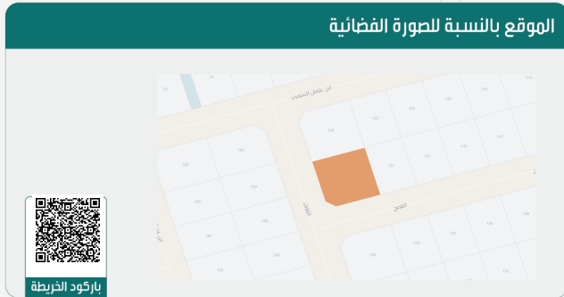
الموقع بالنسبة للصورة الفضائية

* لاستعراض بقية مكونات البناء امسح الباركود الذي في الأعلى