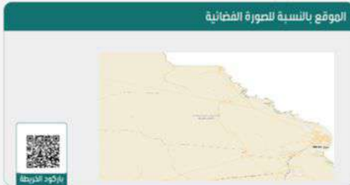
الموقع بالنسبة للصورة الفضائية

*استعراض بقية مكونات البناء امسح الباركود الذي في الأعلى