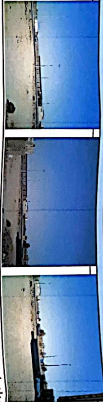
تم اعداد واعتماد هذا الفرز بواسطة المكتب الهندسي وعلى مسئوليتيه صلاحية الفرز المساحي خمس سنوات من تاريخ اعداده