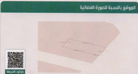
الموقع بالنسبة للصورة الفضائية

*لاستعراض بقية مكونات البناء امسح الباركود الذي في الأعلى