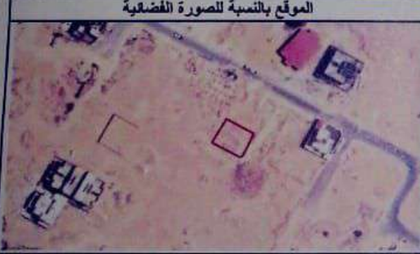
الموقع بالنسبة للصورة الفضائية