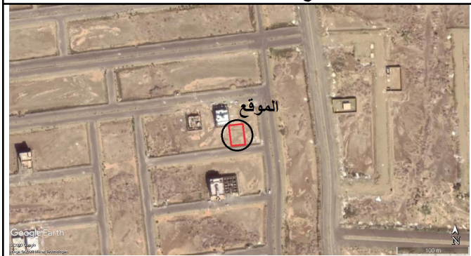
الموقع بالنسبة للصورة الفضائية