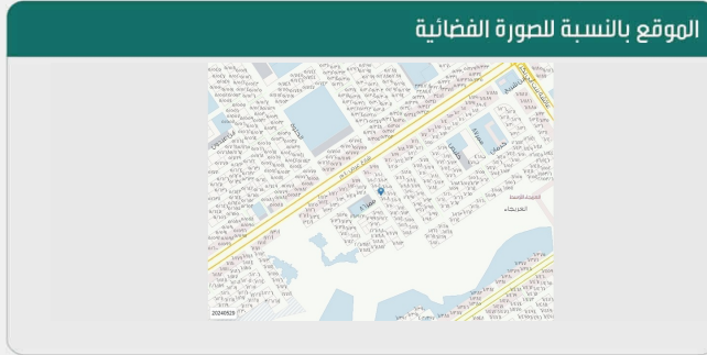
الموقع بالنسبة للصورة الفضائية