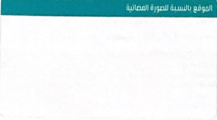
الموقع بالنسبة للصورة العاصية

* لاستعراض بقية مكونات البناء اضغط الباركود الذي في الأعلى