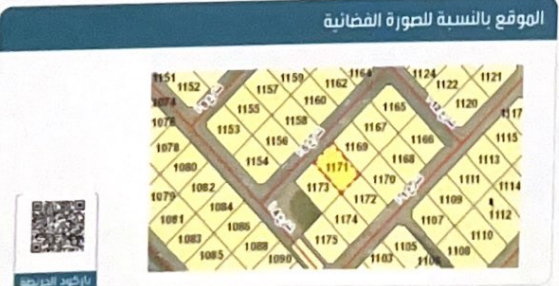
الموقع بالنسبة للصورة الفضائية