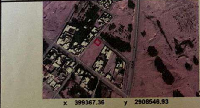
الموقع بالنسبة للمخطط المعتمد