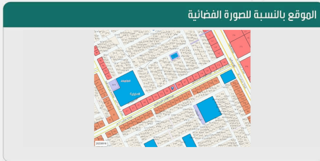
الموقع بالنسبة للصورة الفضائية

*لاستعراض بقية مكونات البناء امسح الباركود الذي في الأعلى