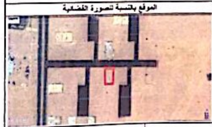
الموقع بالنسبة للصورة الضمنية