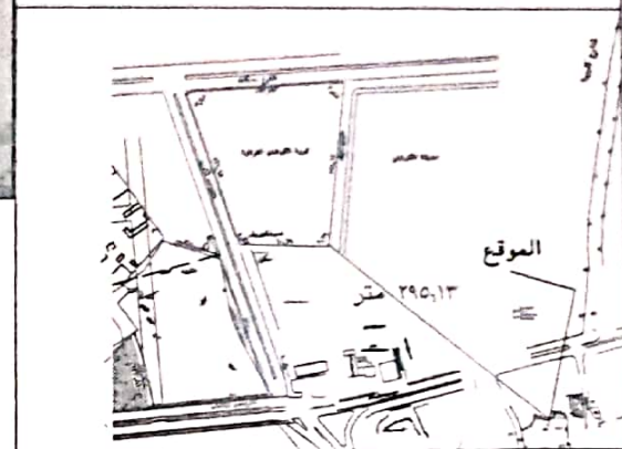
الموضوع كروكي مساحي