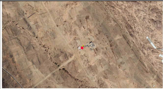
الموقع بالنسبة للصورة الفضائية