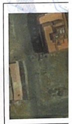
عليه هذه الشروط