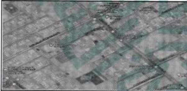
الموقع بالنسبة للصورة الفضائية