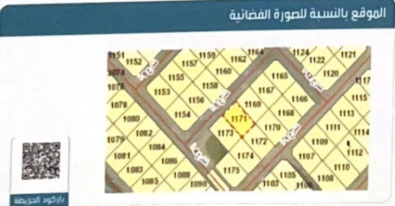
الموقع بالنسبة للصورة الفضائية