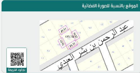
الموقع بالنسبة للصورة الفضائية