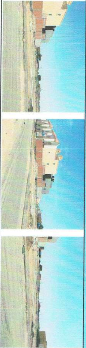
تم اعداد واعتماد هذا القرار بواسطة المكتب الهندسي وعلى مسئولية صلاحية القرار المساحي خمس سنوات من تاريخ اعتماده